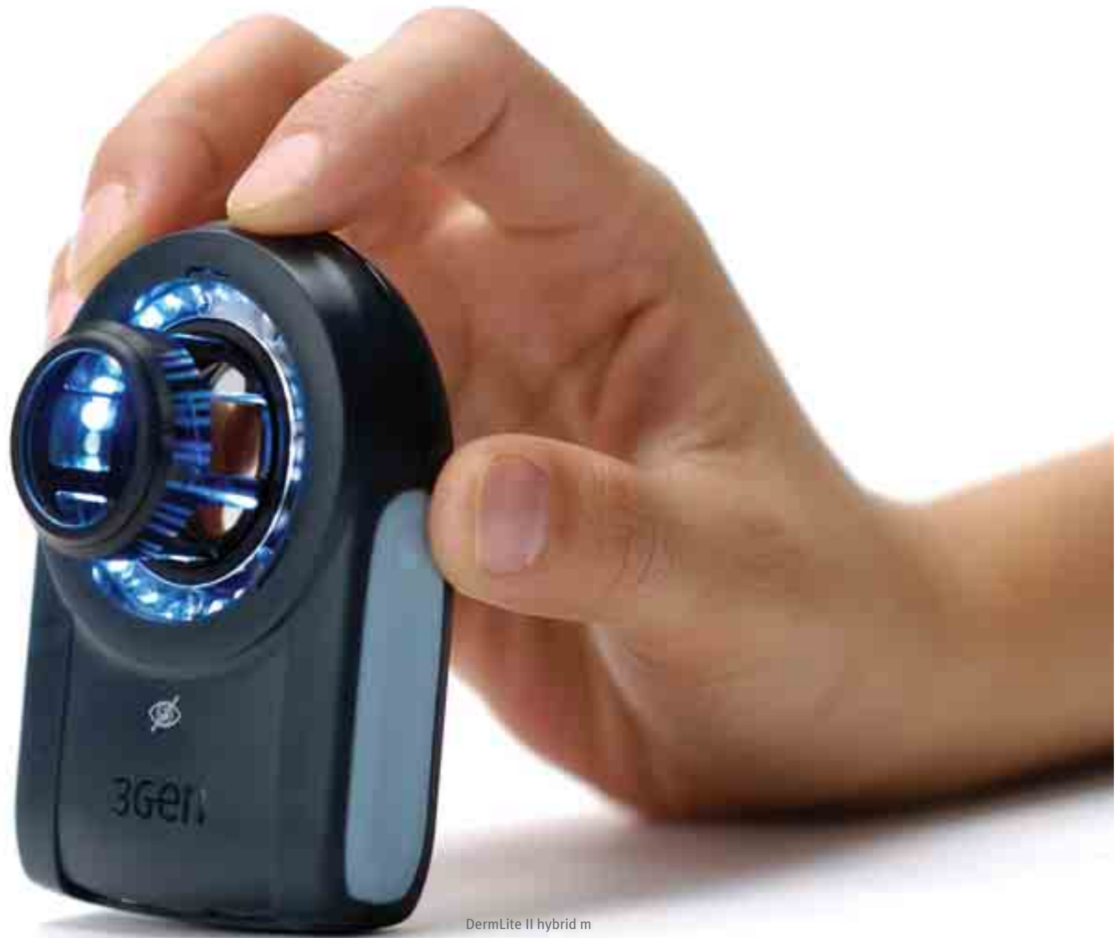
DermLite II hybrid m