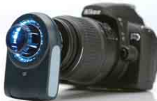
DermLite II hybrid m & Nikon D40

Nuestros aparatos de bolsillo poseen una multitud de aplicaciones, además de la detección del cáncer de piel. La visualización de las lesiones pigmentadas, las venas varicosas, los trasplantes capilares, las irritaciones de la piel y otras lesiones cutáneas es tan sólo el comienzo.