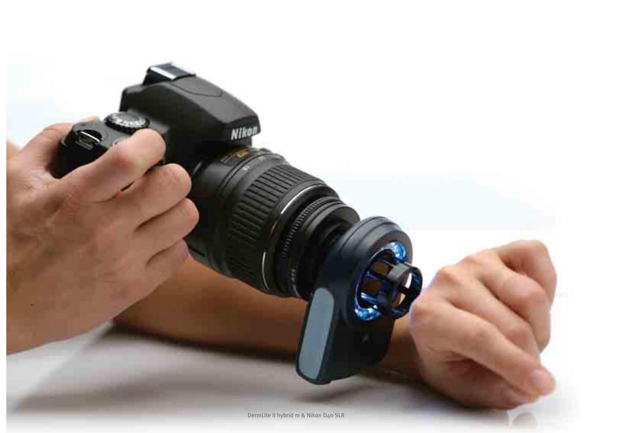
DermLite II hybrid m & Nikon D40 SLR