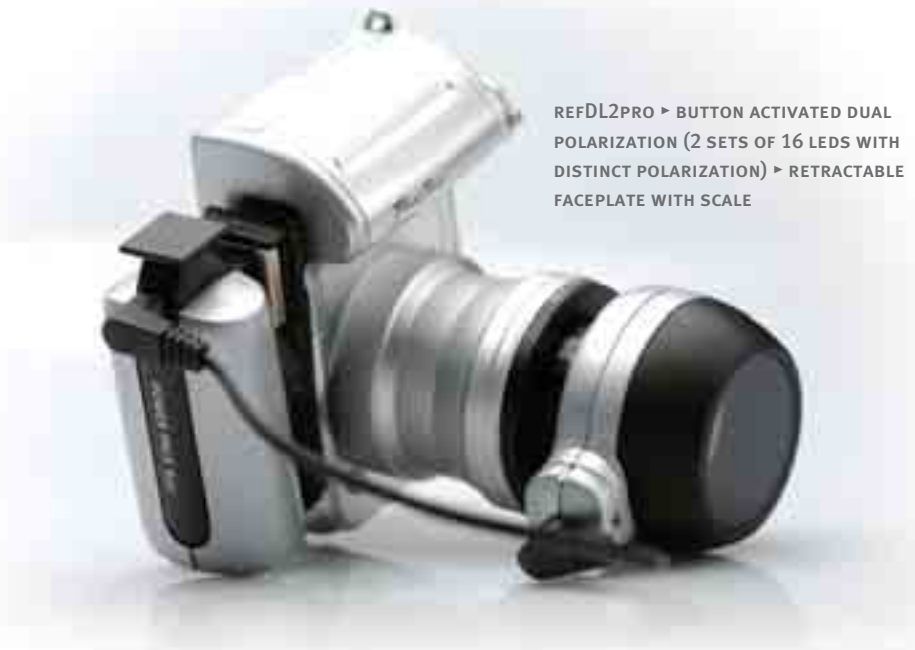
REFDL2PRO ▶ BUTTON ACTIVATED DUAL POLARIZATION (2 SETS OF 16 LEDS WITH DISTINCT POLARIZATION) ▶ RETRACTABLE FACEPLATE WITH SCALE